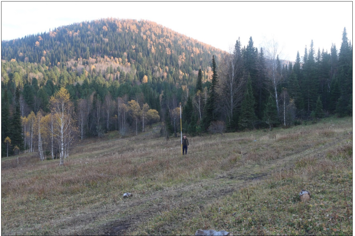
Общий вид на памятник археологии «Урлу-Аспак-2». Проведение археологического надзора.