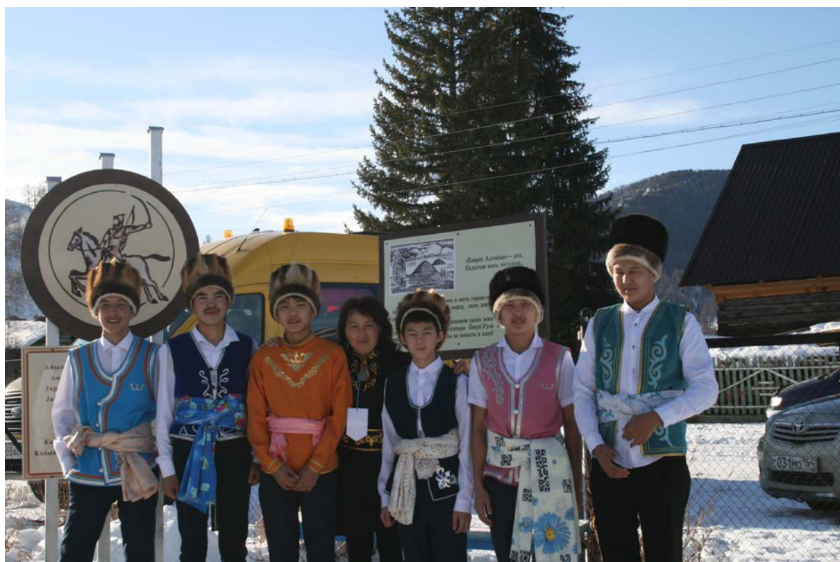
Школьники на открытии памятного знака «Героям-ополченцам, воевавшим против цинских войск в XVIII веке».