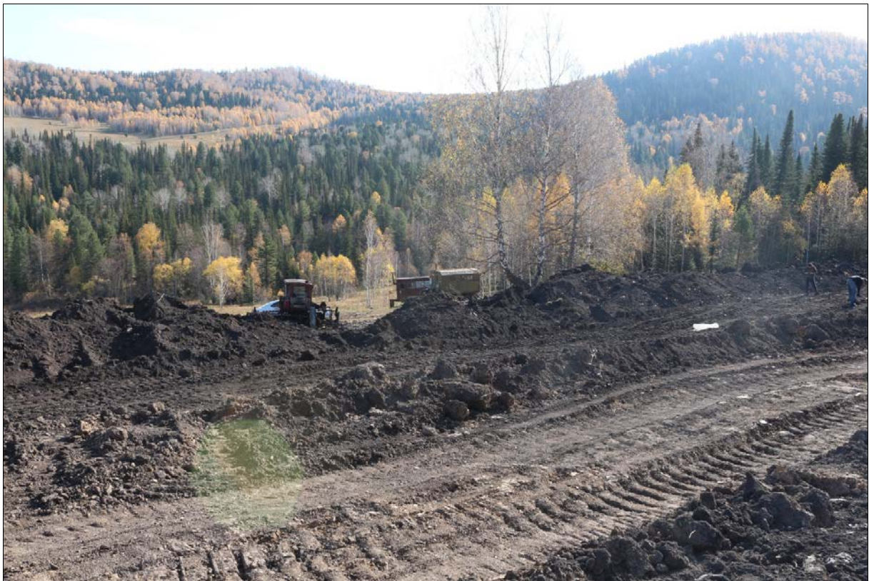
Участок проведения надзора за строительными работами вблизи памятника «Урлу-Аспак-2».