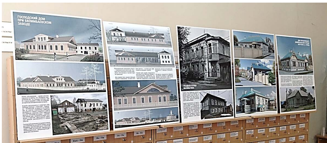
Выставка проектов по сохранению ОКН п. Билимбай, выполненная студентами УралГАХУ.